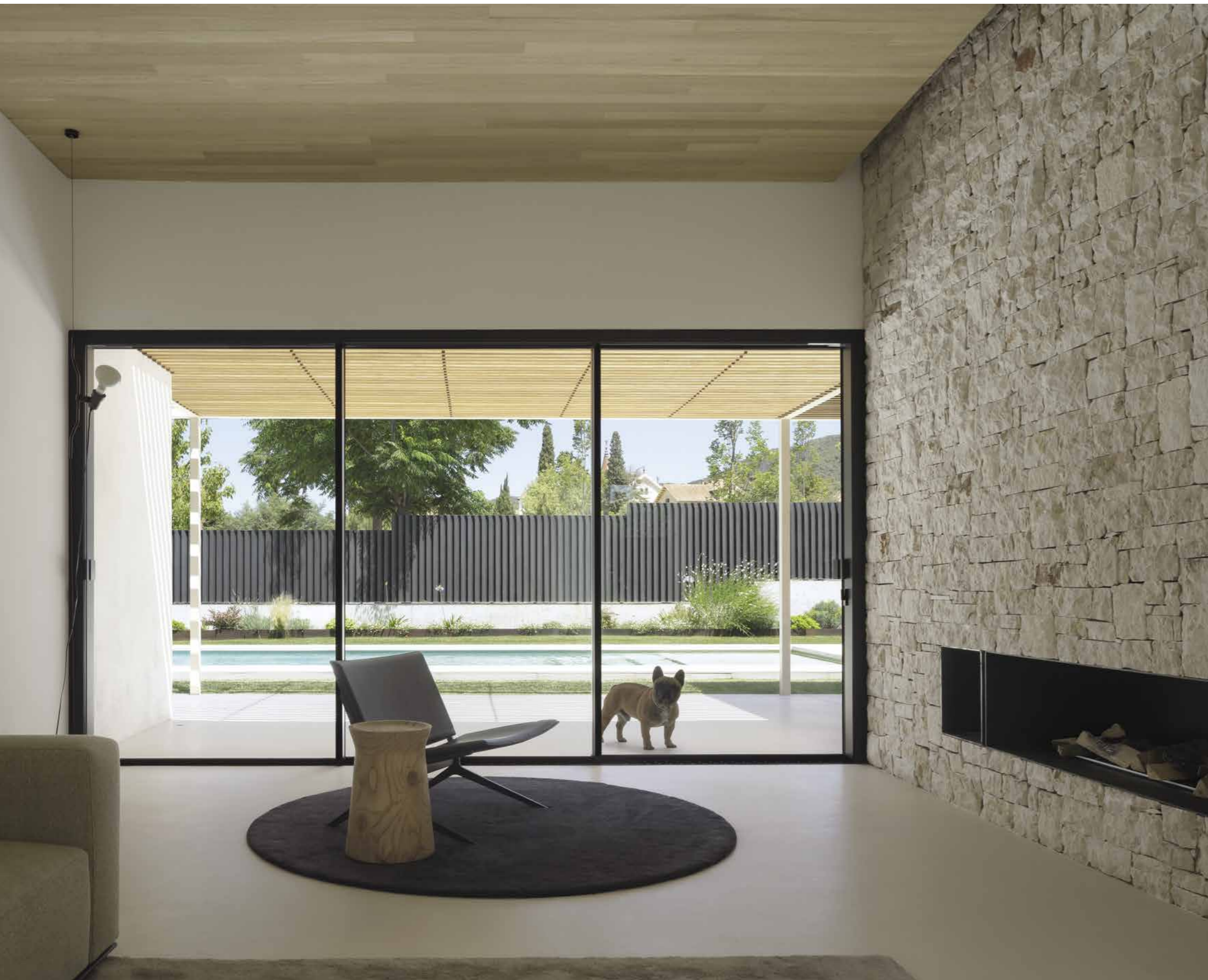
Angolo relax affacciato sul camino moderno inserito in una ruvida parete in pietra calcarea con giunto a secco che contrasta piacevolmente con la vellutata texture di pareti, soffitto e pavimento. Poltrona Kay Lounge di Poliform e tavolino Dama di Poliform.