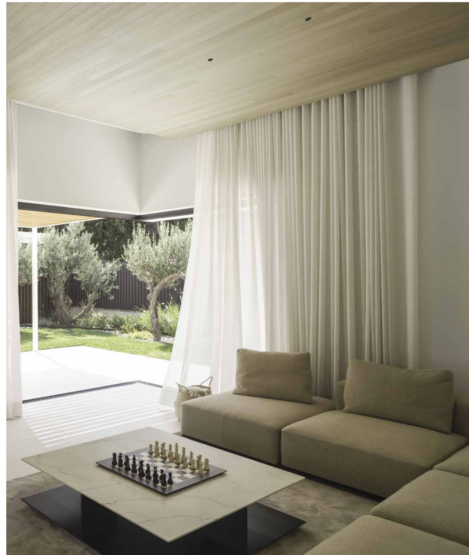
Il salotto è arredato con divano e tavolino Westside di Poliform. Una soffice cascata di tende di lino completa questo elegante angolo relax.