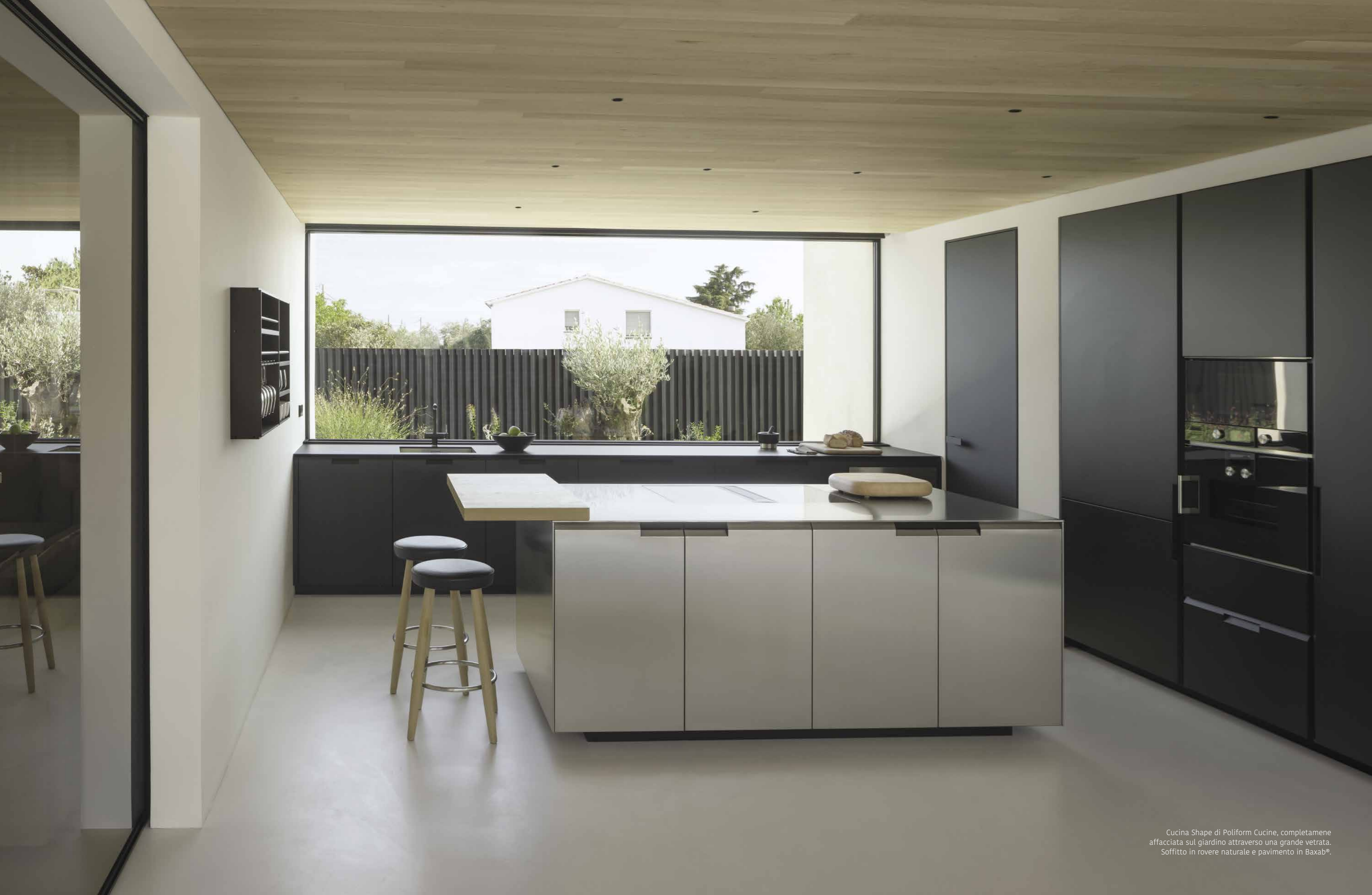
Cucina Shape di Poliform Cucine, completamente affacciata sul giardino attraverso una grande vetrata. Soffitto in rovere naturale e pavimento in Baxab®.