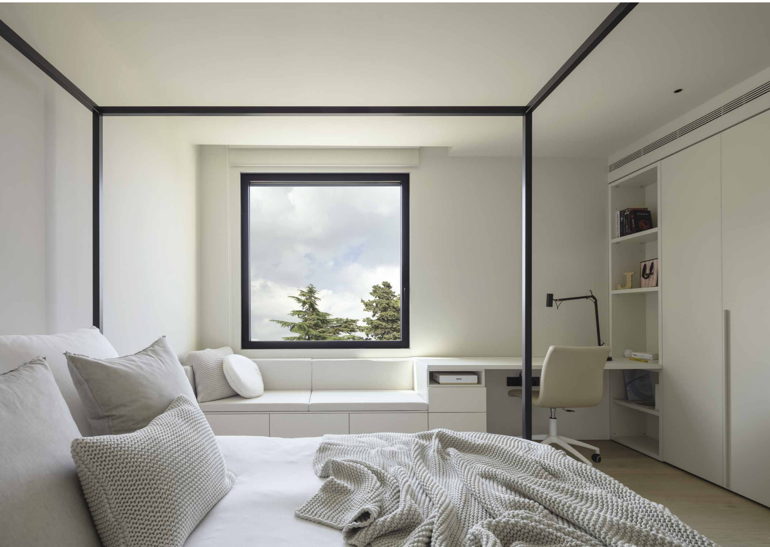
Camera con letto a baldacchino Kap di Nidi Italia; dello stesso brand anche il resto dell'arredo realizzato a misura con divano contenitore che passa sotto la finestra e si collega alla scrivania. Pavimento in rovere naturale.