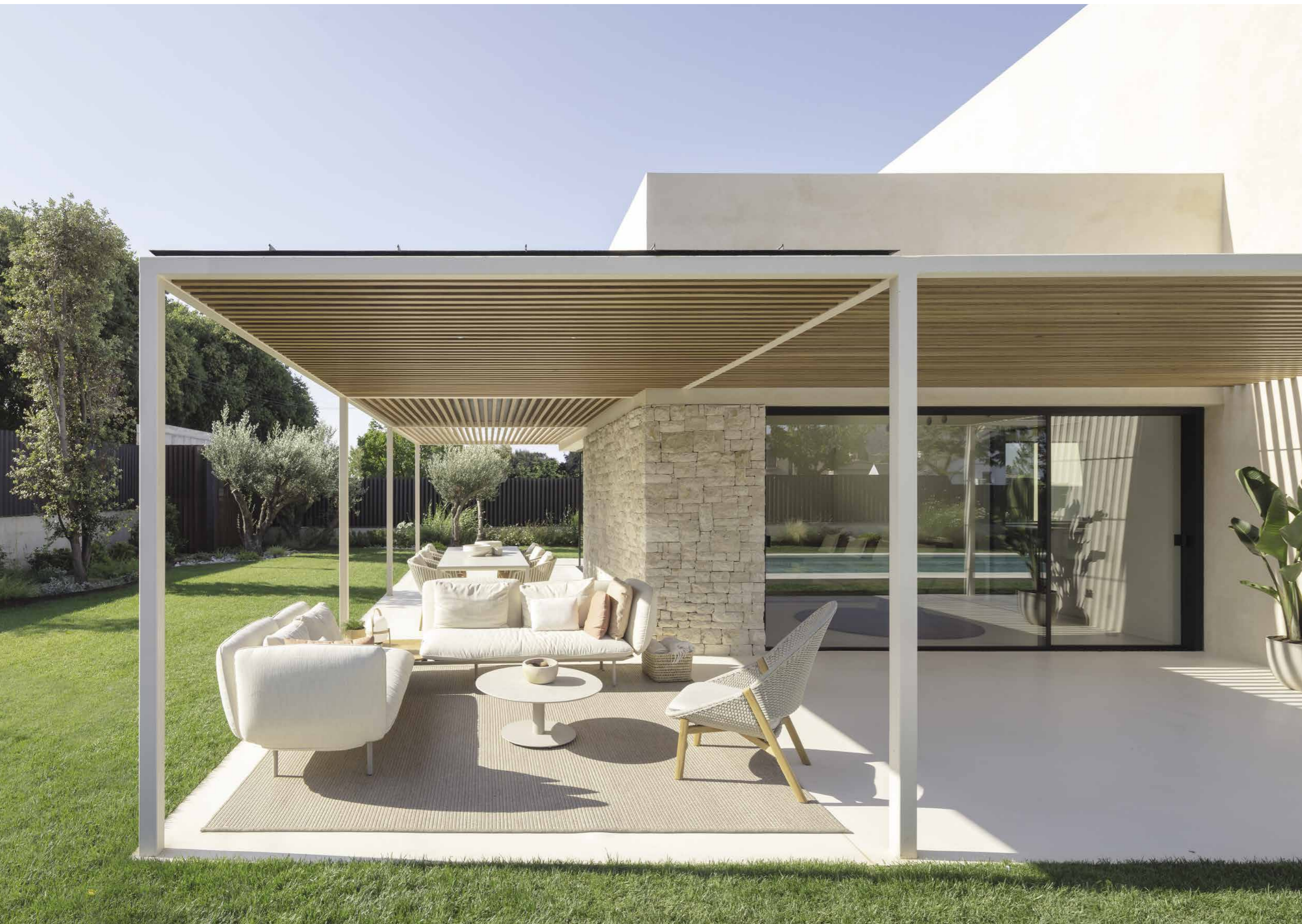
Anche il pergolato è stato allestito con estrema cura ed eleganza utilizzando un arredo per esterni firmato Tribù.