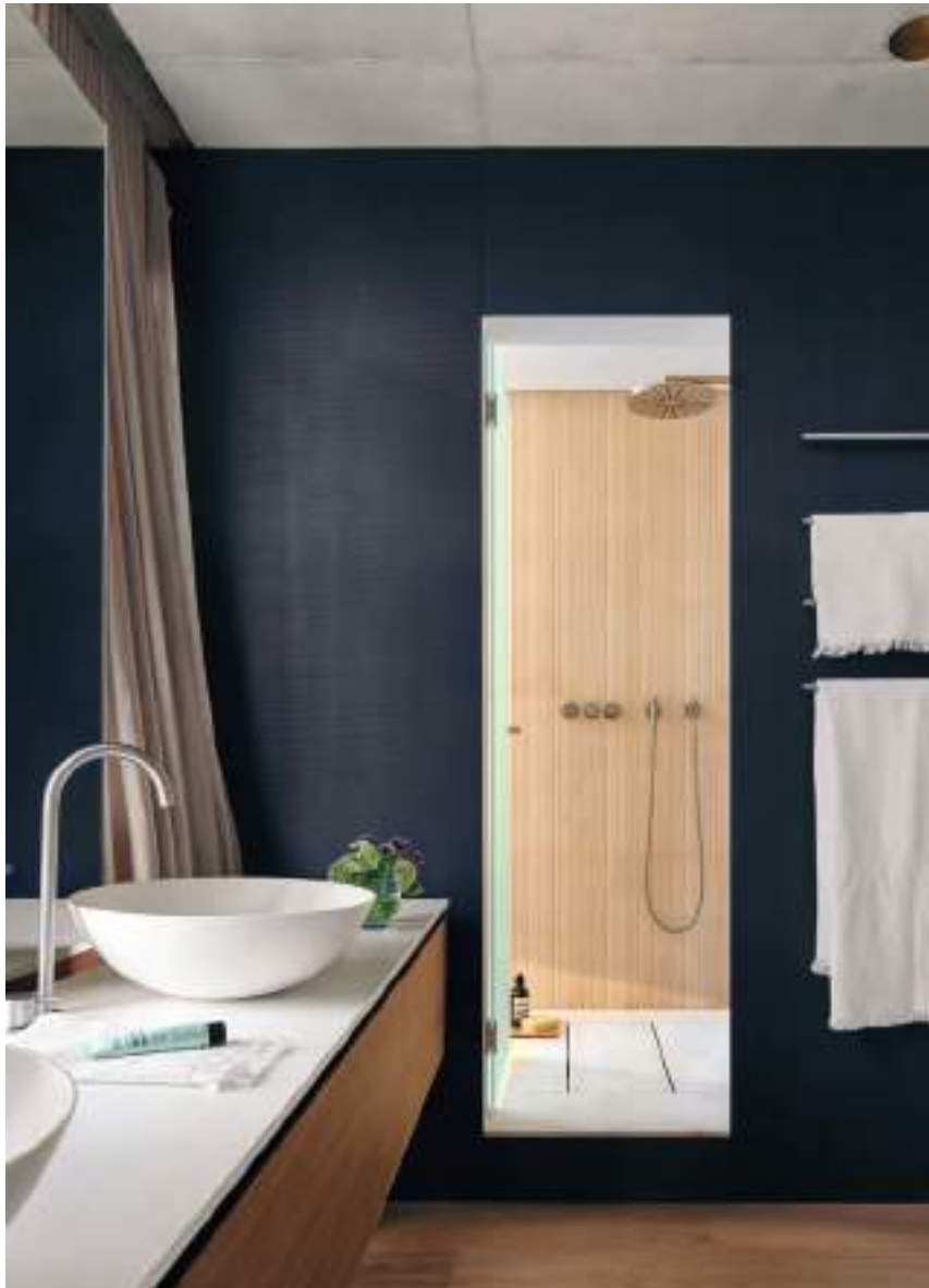
En el baño principal, los lavamanos exentos son de la marca Falper, que distribuye Gunni & Trentino. La grifería es de Vola, con acabado de acero inoxidable cepillado. Toalleros, de Boffi. El plato de ducha y el revestimiento de las paredes son de la firma Salvatori.