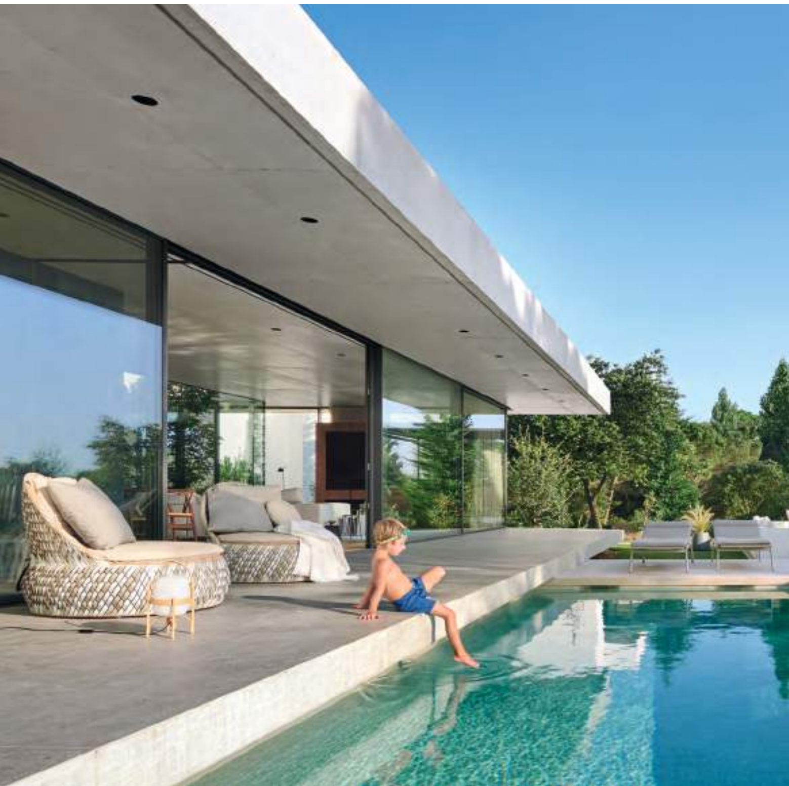
En primer plano, butacas y mesita de la colección Dala, de Stephen Burks para Dedon. De frente, las tumbonas Brunch, de Tribù, diseño