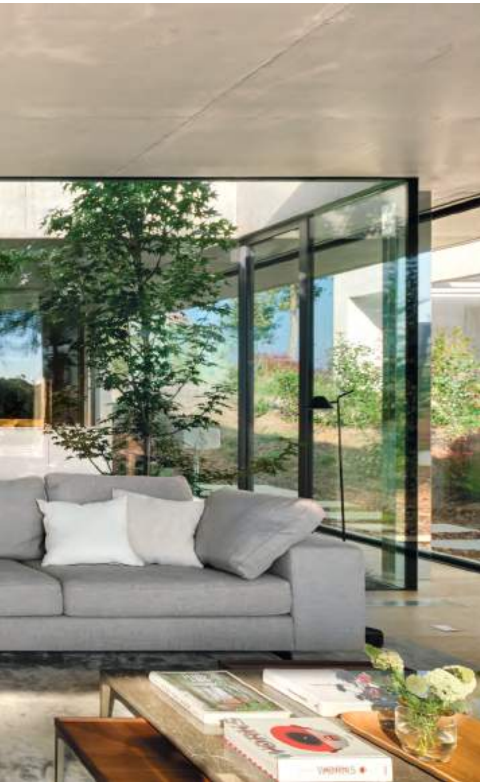
Sofá Landscape, de Piero Lissoni para De Padova, con cojines de lino, de Zara Home. Mesas auxiliares Tray, de Rimadesio.