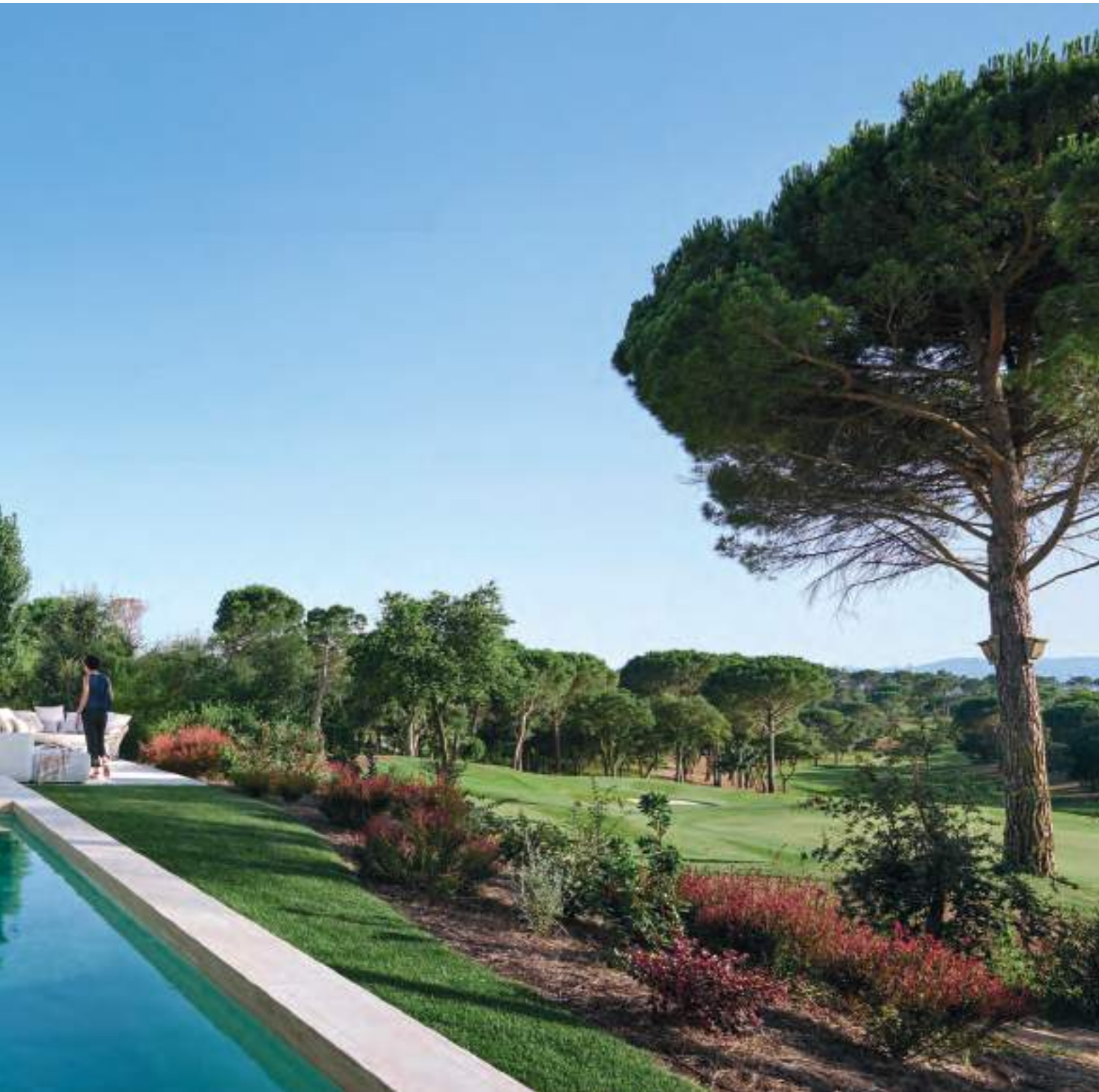
de Lievore Altherr Molina, al igual que la mesa auxiliar Grada del fondo, acompañada de sofás de la colección Plump; ambos, de Expormim.