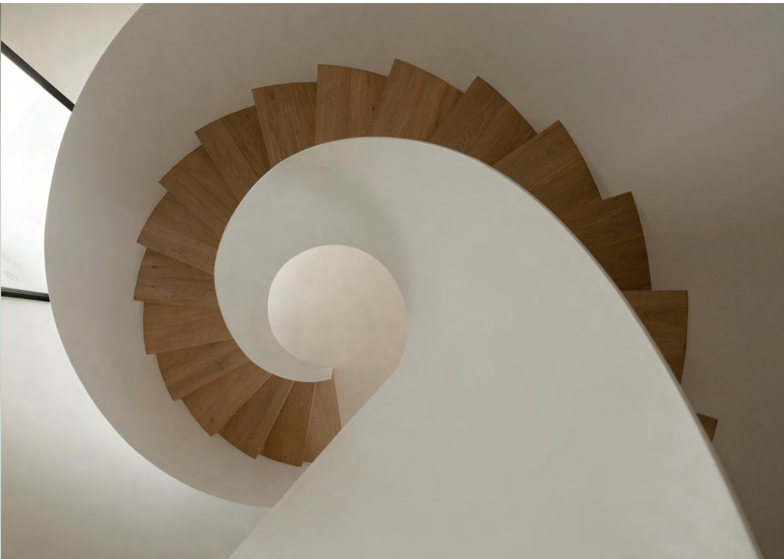
La chimenea angular es de piedra calcárea con junta seca. Visión cenital de la elegante escalera helicoidal que comunica las dos plantas.