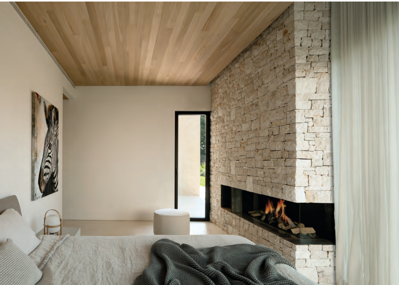
En la suite, la cama Jacqueline y el puf New York, de Jean-Marie Massaud para Poliform. Lámpara Cesta, de Miguel Milá para Santa & Cole.