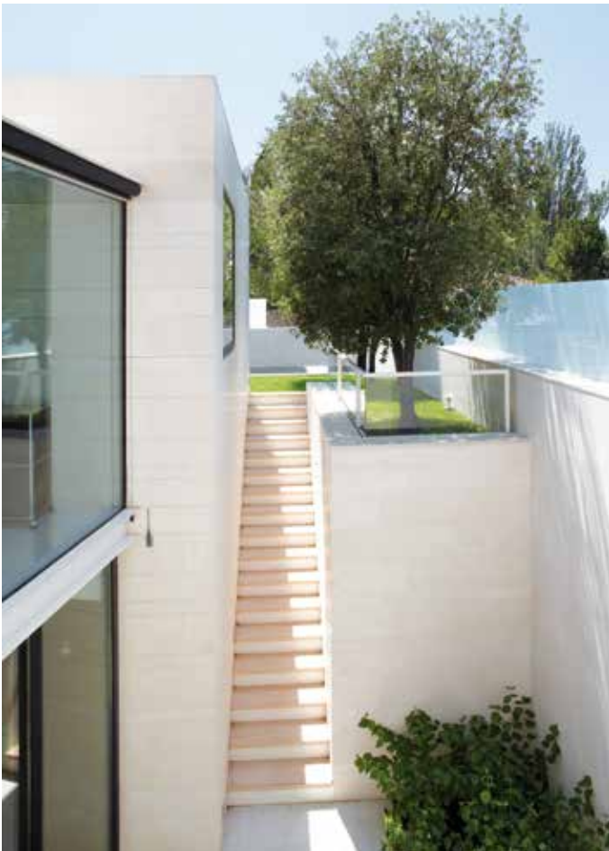
TEXTOS: ADA MARQUÉS.

La historia de esta casa empezó con una pequeña maqueta de cerámica y madera hecha por dos hijos para su madre, que representaba el regalo de su marido. La historia de la construcción es, en realidad, una historia de amor que se traduce en una arquitectura que cuida la sensibilidad sensorial de las personas que viven allí.