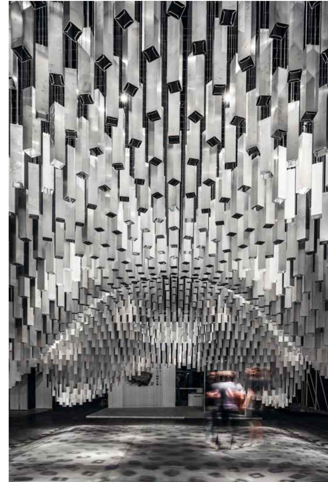
Estand Aluilux | Aluilux stand

Localización Location: Barcelona. Spain. Equipo Team: Jaime Prous Architects | Jaime Prous, Antón Monedero, Àlex Pineda. Colaboradores Collaborators: Eduard Romero, Nara Llapart, Oriol Capdevila, Pere Masó. Cliente Client: Aluilux & Metall-lux. Superficie Area: 108m 2 . Fecha de la obra Date of the works: Construmat 2017.